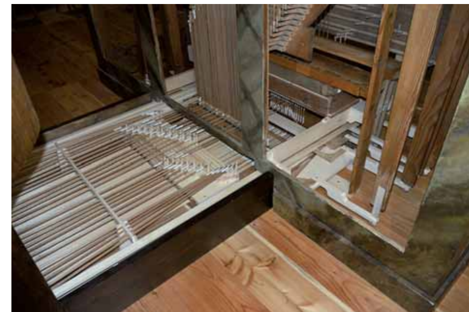
Rekonštruované ovládanie organa

Reštaurovaním národnej kultúrnej pamiatky organa v kostole Sedembolestnej Panny Márie získali nielen Vajnory, ale aj Bratislava a okolie jedinečný doklad hudobnej kultúry na území Slovenska z čias zač. 19. st. Napriek relatívne vysokému počtu historických organov na území Slovenska, väčšina je vo veľmi zlom stave. Ukážkovo zreštaurovaných organov je stále málo, o to cennejšie je odhodlanie vlastníka tejto pamiatky a obyvateľov Vajnora podieľať sa na tomto náročnom projekte. Odmenu je umelecké dielo, ktoré presviedča svojou krásou a najmä zvukovou farebnosťou.