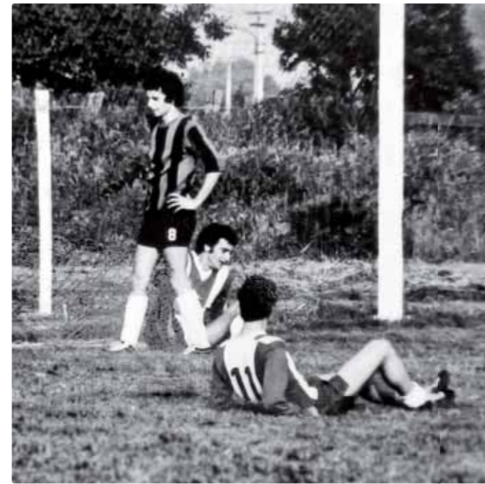
S číslom 11 po inkasovanom góle