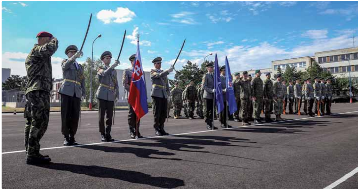
Ceremonia výmeny veliteľa NFIU SVK, 1.8.2022

môže byť zložitá. Keď človek robí povolanie, kde sa musí prispôbiť, lebo je to súčasť jeho života a na druhej strane sa musí zodpovedne rozhodovať a ovplyvňovať životy iných, tak sa to na ňom „podpíše“ či to chce, alebo nie. Ja som osobne presvedčený, že som úplne normálny, veselý, možno aj príjemný človek. Či je to presne tak, to musia posúdiť iní. Ale po tých rokoch asi na mne vidieť, že som vojak, ktorý zvlášť nešpekuluje nad tým, čo by mal urobiť, alebo čo k nemu prichádza. Zvážim, vyhodnotím, urobím záver, potom nad tým zvlášť nerozmýšlam, lebo z môjho pohľadu to