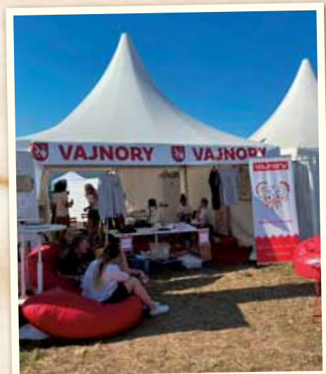
Na Lovestreame sme propagovali Vajnory v stánku mestskej časti