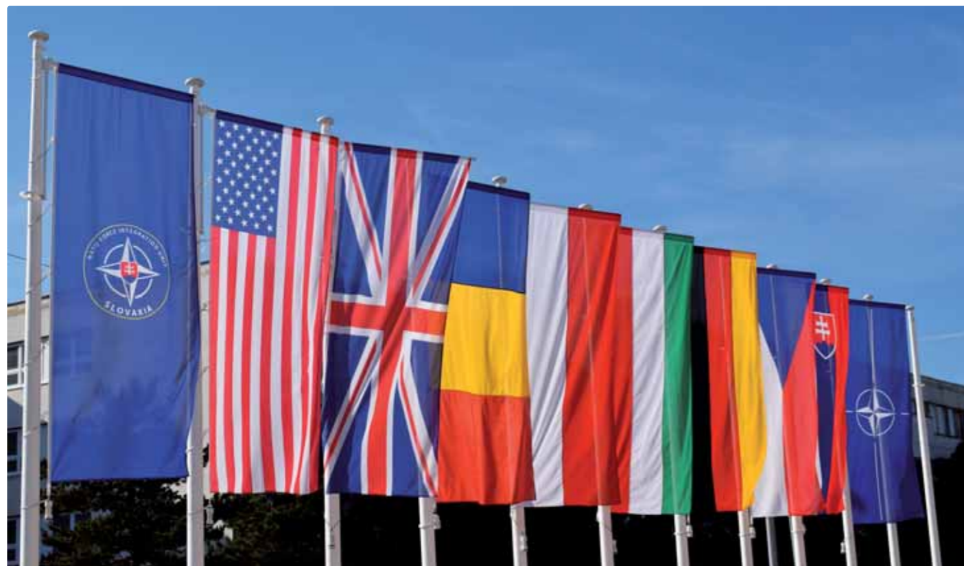
Vlajky aktuálnych prispievateľských krajín do NFIU SVK

mentu v Nemeckom Heidelbergu, súčasťou ktorého bolo nasadenie do operácie ISAF v Afganistane, kde sme prebrali kľúčové pozície velenia tejto operácie v Kábule. Tam som pôsobil ako vedúci smeny „Shift Director“, spoločného operačného centra „JOC“ a mal som na starosti prípravu, vykonávanie, riadenie a monitorovanie všetkých operácií, ktoré prebiehali na území Afganistanu.