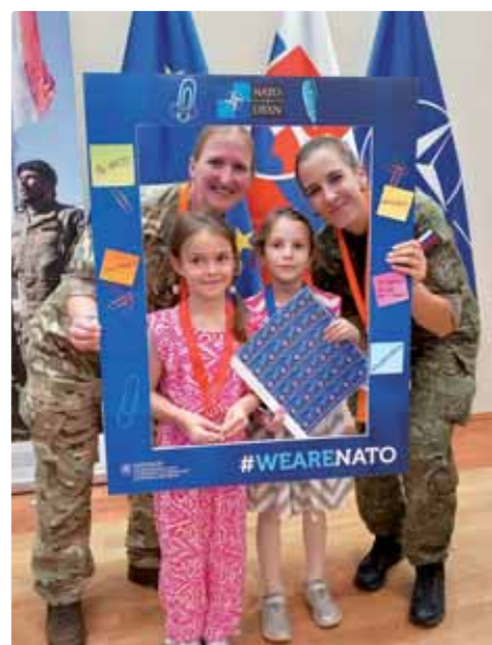
Prezentácia NFIU SVK a spolupráca s MZV v rámci Dňa otvorenej diplomacie na MZVaEZ SR, 17. 6. 2023

2013-2014, kde som pôsobil opäť na veliteľstve ISAF v Kábule, pol roka som pôsobil na pozícii šéfa jednej z buniek divízie, ktorá zodpovedala za dlhodobé plánovanie operácie a ďalší polrok som bol zástupcom veliteľa tejto divízie, ktorým bol britský generál. Zodpovedal som okrem iného na svojej úrovni za plánovanie a vykonanie prezidentských volieb a transformáciu bojovej operácie ISAF na asistenčnú operáciu RS, no nie tak, ako sa de facto ukončila.