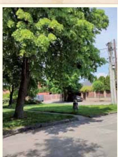
Pravidelne sme sa starali o zeleň