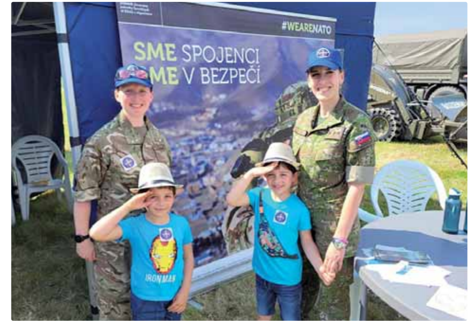
Prezentácia a info kampaň NFIU SVK na Festivale letectva v Piešťanoch, 20. – 21. 5. 2023