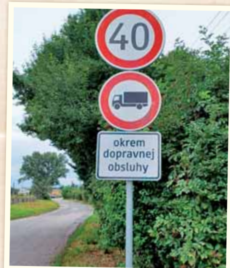
V niektorých lokalitách bolo v záujme bezpečnosti osadené nové dopravné značenie