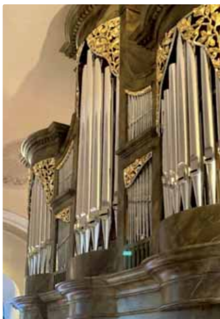
Vajnorský organ – celkový pohľad

Tak ako sa počas histórie menilo ovládanie organa, menilo sa aj usporiadanie píšťal