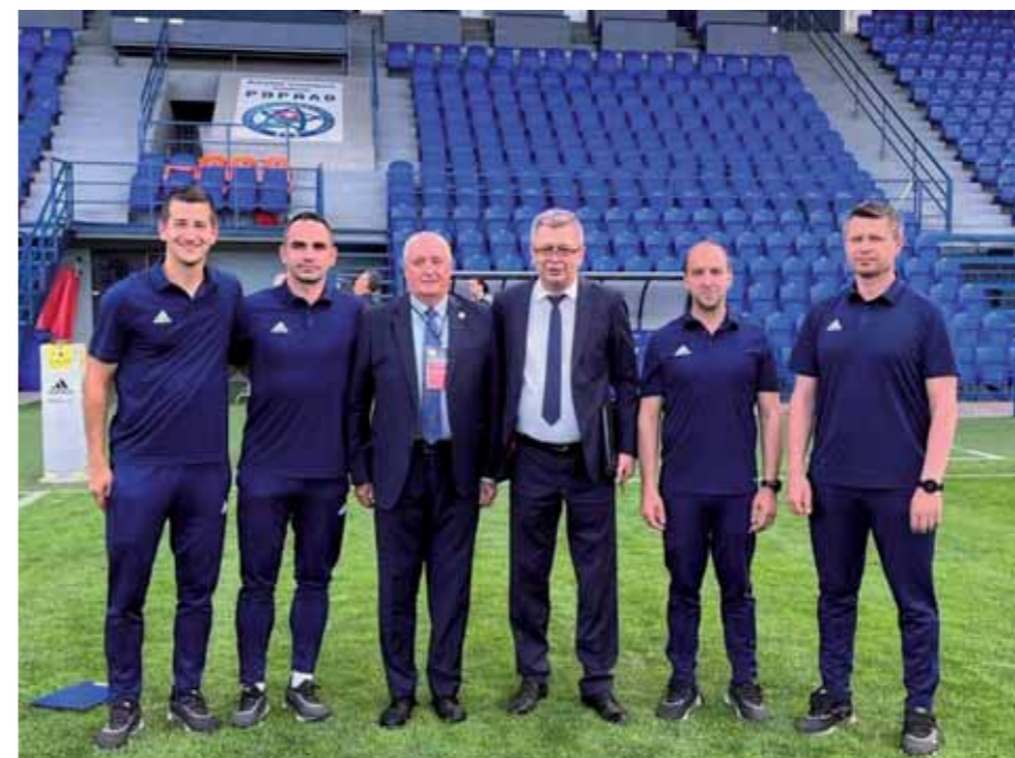
Pred posledným zápasom v úlohe delegáta

ho v roku 1996 zavolať do pozície sekretára. Onedlho začal popri tom robiť delegáta. Po skončení rozhodovania vznikla aj divná situácia, keďže už bol ako delegát na listine UEFA zo strany SFZ, ale Bratislavský futbalový zväz ho nechal začínať v 4.lige. „Bolo to komické. Jeden deň som bol delegát v Lábe a na druhý v Leverkusene. Rýchlo sa to ale upravilo.“ Neskôr prešiel na zväze na medzinárodný úsek. Najväčšia láska v podobe seminárov o pravidlách mu ale ostala až do posledných týždňov kariéry. „Vždy som všetko veľa rozpisoval, na rozdiel od niektorých iných. Ja som bol skôr na to.“