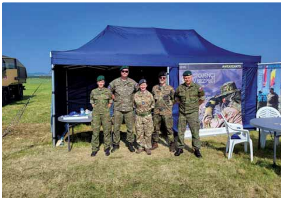
Náš tím počas kampane WeAreNATO na Festivale letectva v Piešťanoch, 20. – 21. 5. 2023

V rokoch 2005 – 2008 som pôsobil na Spojeneckom veliteľstve pozemného kompo-