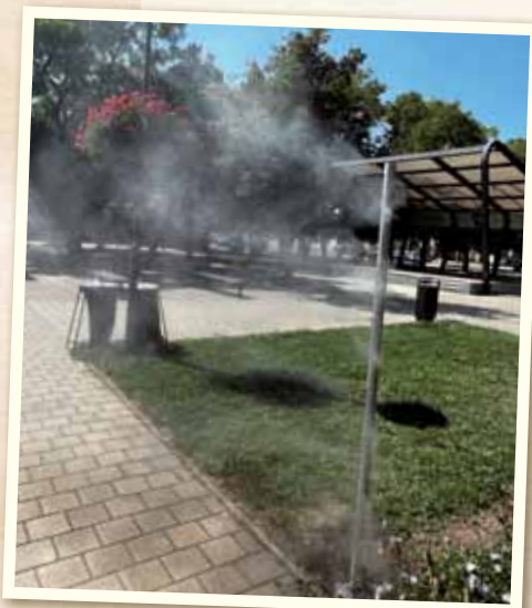
Z participatívneho rozpočtu sme inštalovali osviežujúcu vodnú fontánu