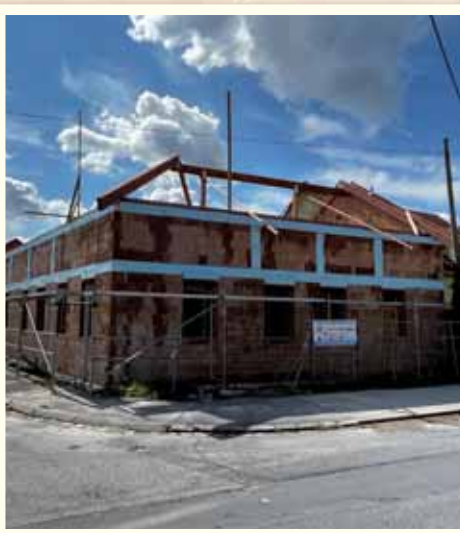
Práce na stavbe senior domu rýchlo pokračujú