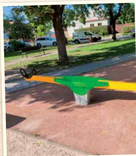
Osadili sme novú hojdačku pre deti v Parku pod lipami