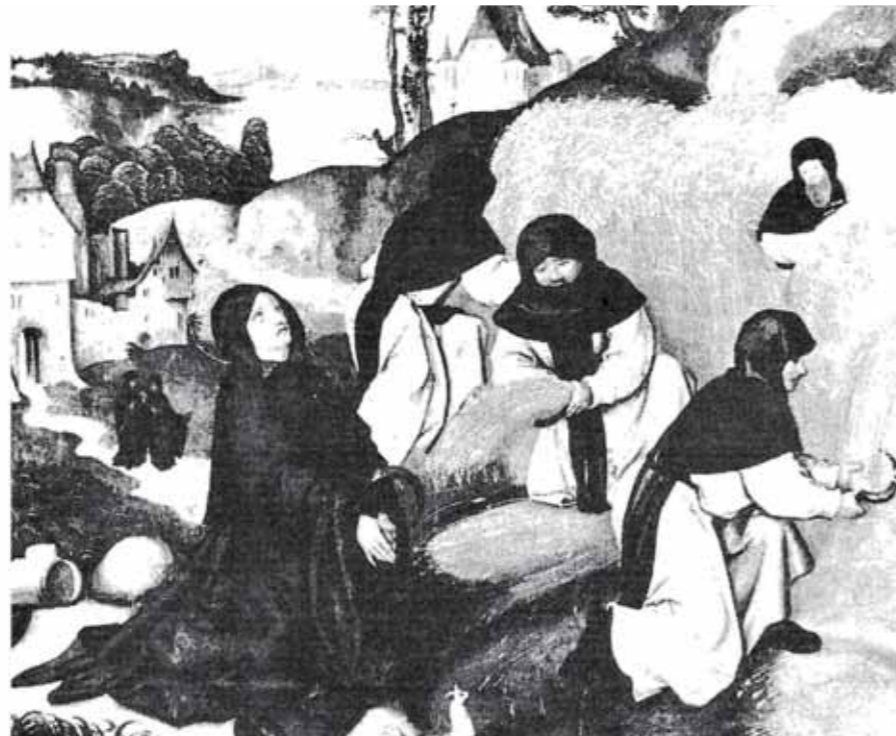
Cisterciiti pri práci

Osobitnú dejinnú kapitolu predstavovala rehoľa cistercitov (založená v roku 1098), ktorá sa neskôr priamo dotkla aj dejín Vajnory.