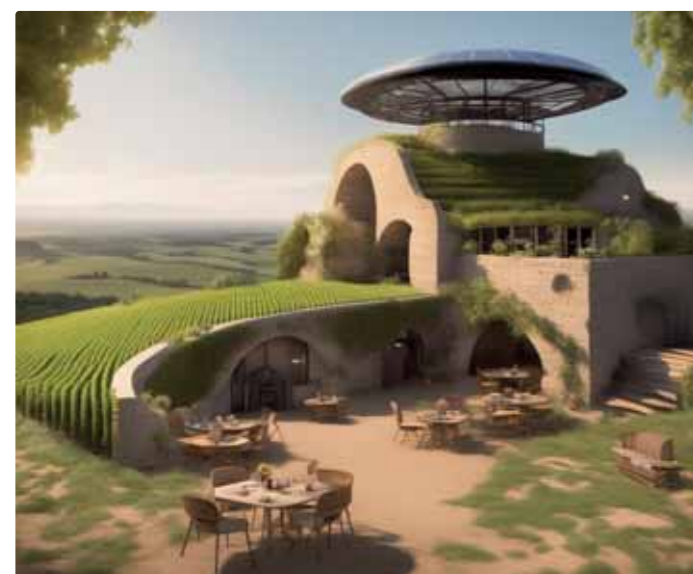
Obrázok generovaný umelou inteligenciou https://clipdrop.co/ na základe opisu v texte

Na konci pivničného oblúka sa nachádza malá vyhlídková veža pretkaná solárnymi panelmi a na vrchu malé útulné bistro pre hostí s výhľadom na celý chotár. Samozrejme, je to aj centrum pre rádiovú komunikáciu so senzormi a automatickými strojmi rozmiestnenými po celom okolí. Samotná pivnica stojí na obrovskom bazéne a uchováva vo svojich útrobach 5000 metrov kubických vody z okolitých potokov. Voda sa používa na kvapkovú závlahu