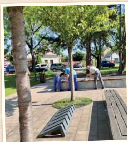
Natierali sme miesta na sedenie a oddych v Parku pod lipami