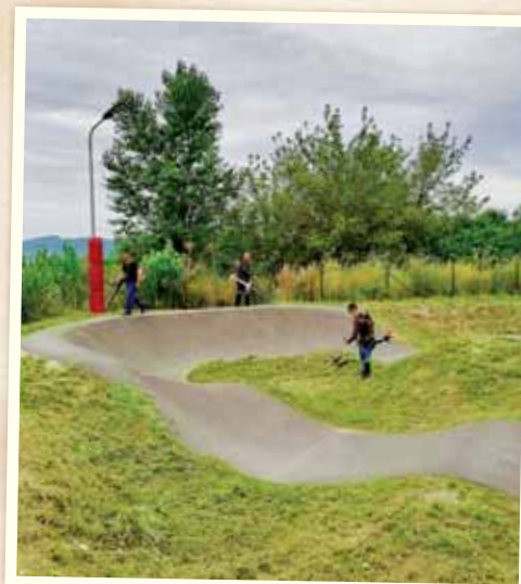
Upravovali sme okolie pumptracku