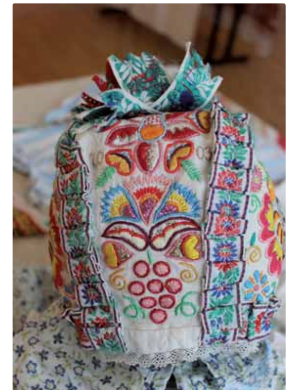
zadná strana, čepček pre bábiku, Katarína Rakúsová