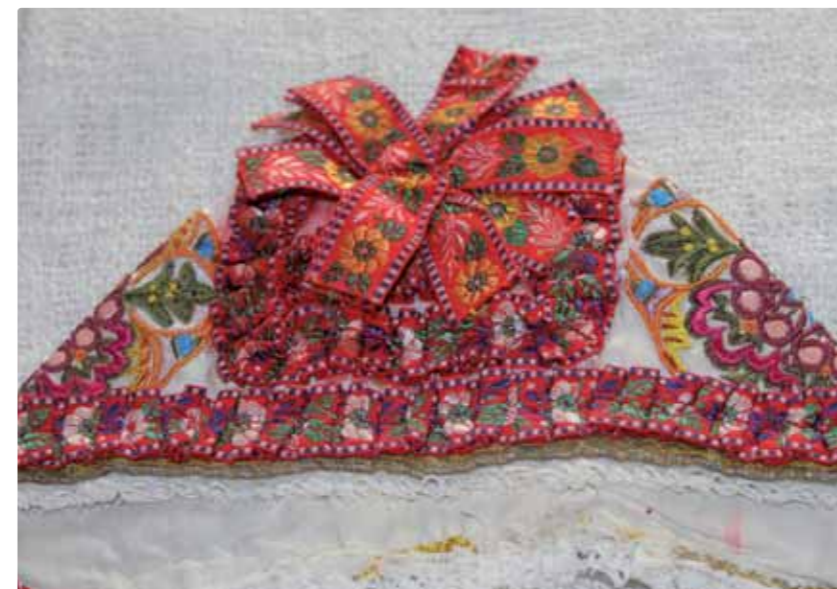
horná strana čepčka s mašličkou zo stužiek, autorka M. Zemanová